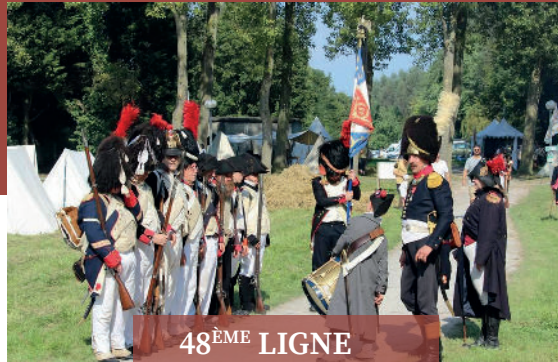
48 ÈME LIGNE