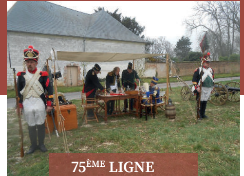
75 ÈME LIGNE

Samedi et dimanche LES VISITES GUIDÉES : Devant le logis du major Fort Risban